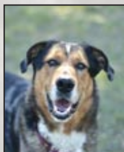
RADJAH Mâle croisé Beauceron de 47 kg, bientôt 2 ans

Titan peut se montrer sur la réserve lors des premiers contacts, surtout avec les hommes mais devient très rapidement proche de l'humain une fois en confiance. C'est un chien qui cherche le contact et ne demande qu'à créer du lien avec lui. Derrière les grilles, Titan fait semblant de garder son territoire en aboyant sur les inconnus. Arrivé très maigre au refuge, il n'a malheureusement pas toujours eu ce dont il avait besoin pour son bon développement notamment en termes de stimulation et d'apprentissage. Malgré cela c'est un chien volontaire, curieux et désireux d'apprendre. Il souhaite également côtoyer ses congénères même si ses codes canins ne sont pas toujours adaptés ce qui demandera un accompagnement doux et progressif. Titan se laisse plutôt bien manipuler ce qui facilitera son évolution. Il est en train d'apprendre les ordres de base et son envie de bien faire et sa proximité avec l'humain en font un chien plein de potentiel prêt à s'épanouir auprès d'une famille patiente investie et bienveillante.