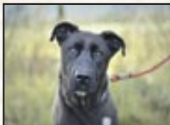
TITAN Mâle Berger x Labrador de 28 kg, 3 ans et demi

Pour avoir plus de renseignements sur les chiens et les conditions d'adoption, merci de visiter notre site internet : www.sanscollier-provence.org